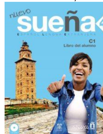
NUEVO SUEÑA 4: LIBRO DEL ALUMNO ISBN 978-84-698-2796-3

(6 anos de aprendizagem – início no 7º ano)